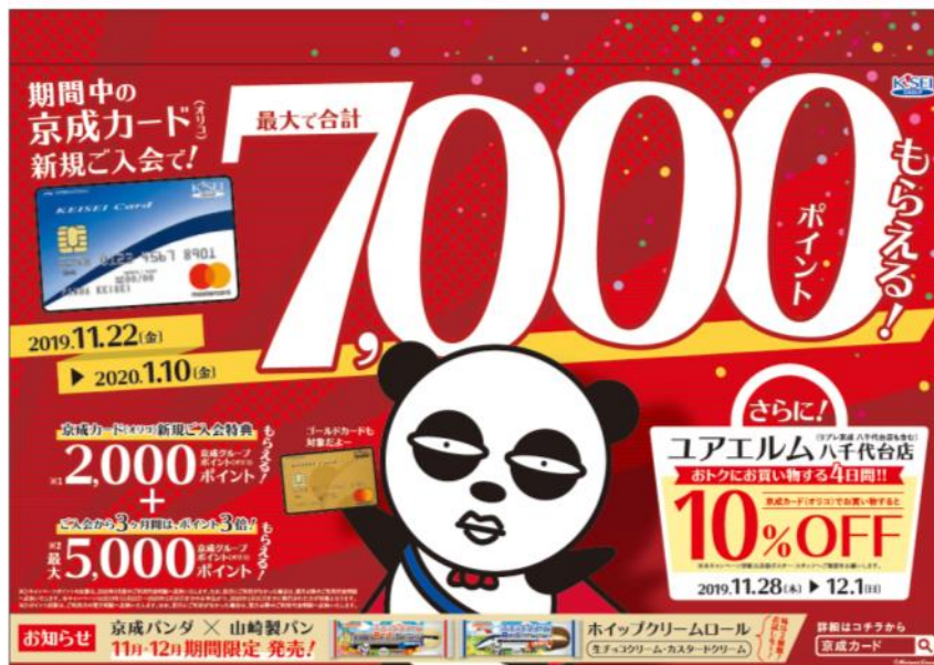
キャンペーンポスター（イメージ）