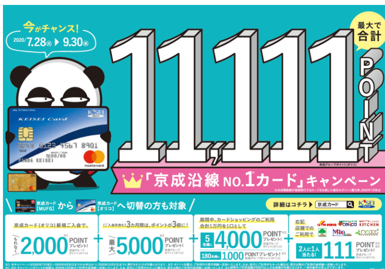
キャンペーンポスター(イメージ)