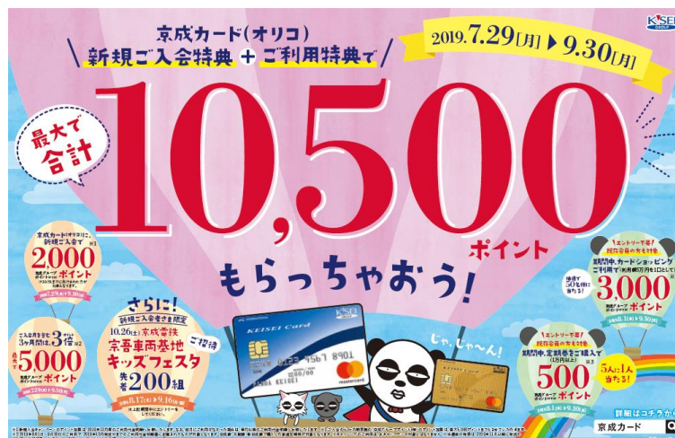
キャンペーンポスター（イメージ）