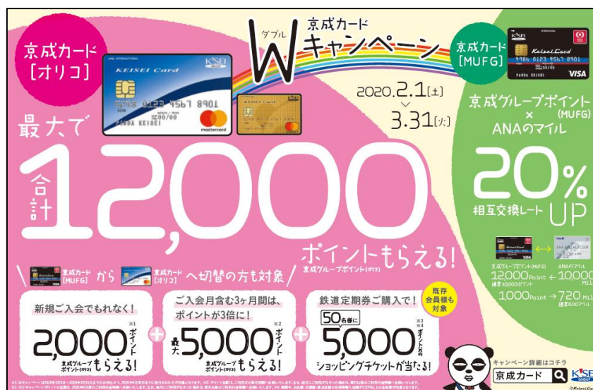
キャンペーンポスター(イメージ)